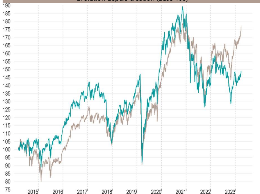
Evolution depuis création (base 100)

— Talence Euromidcap — Indice de référence