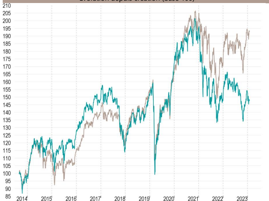
— Talence Euromidcap — Indice de référence

Les performances passées ne préjugent pas des performances futures et ne sont pas constantes dans le temps.