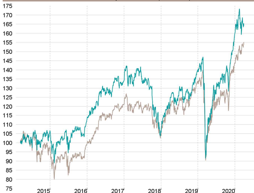
Evolution depuis création (base 100)

— Talence Euromidcap — Indice de référence