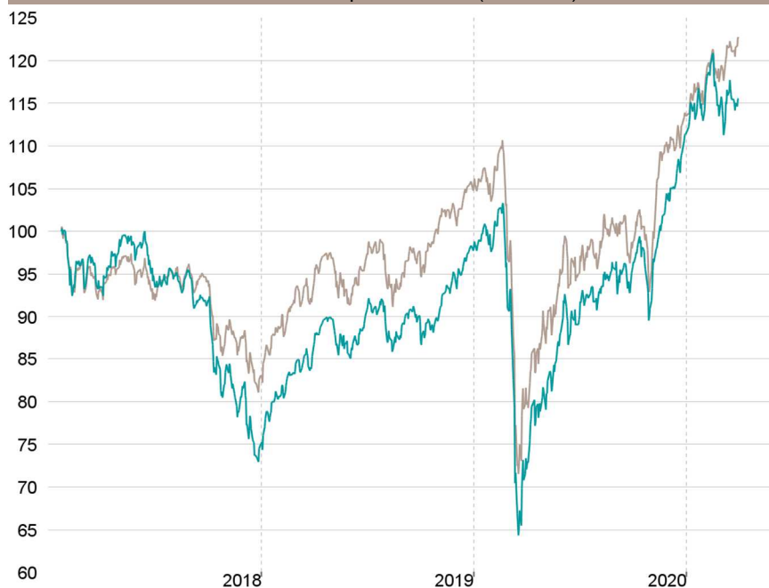
Evolution depuis création (base 100)

— Talence Euromidcap — Indice de référence