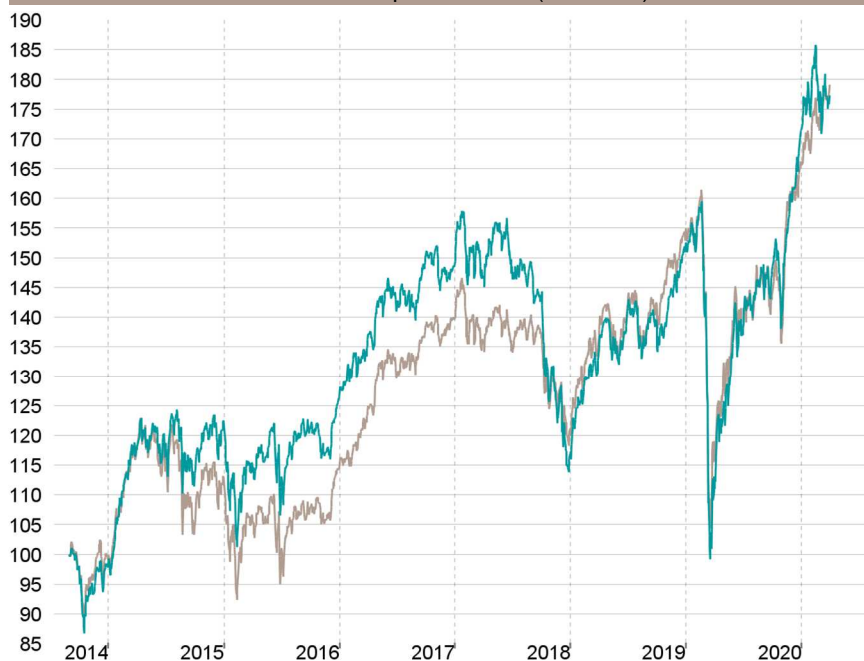
Evolution depuis création (base 100)

— Talence Euromidcap — Indice de référence