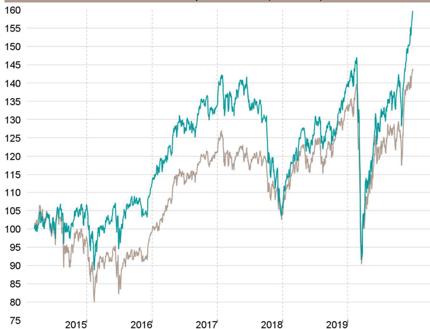
Evolution depuis création (base 100)

— Talence Euromidcap — Indice de référence