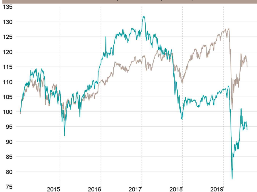
Evolution depuis création (base 100)