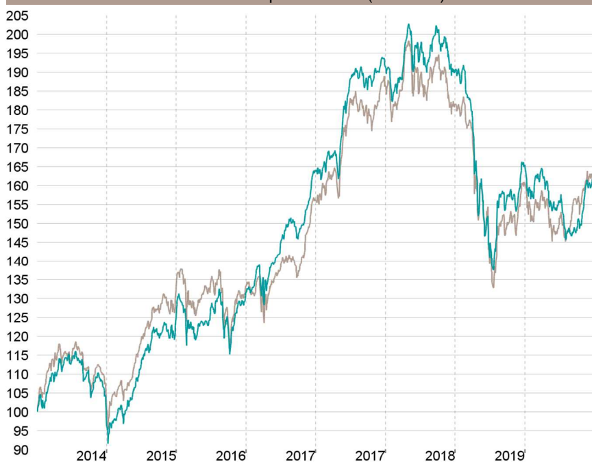
Evolution depuis création (base 100)

— Talence Selection PME — Indice de référence