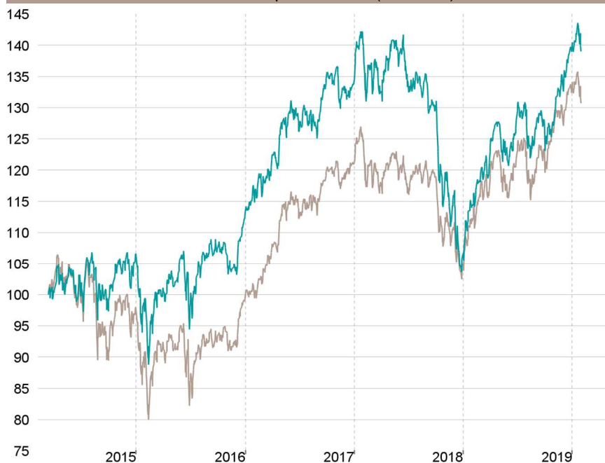
Evolution depuis création (base 100)

— Talence Euromidcap — Indice de référence