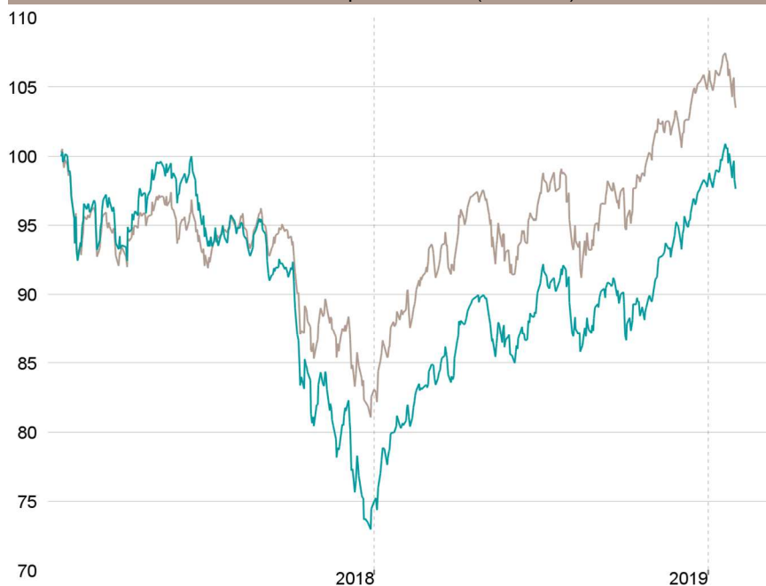
Evolution depuis création (base 100)

— Talence Euromidcap — Indice de référence