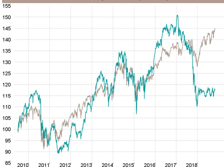
Evolution depuis création (base 100)