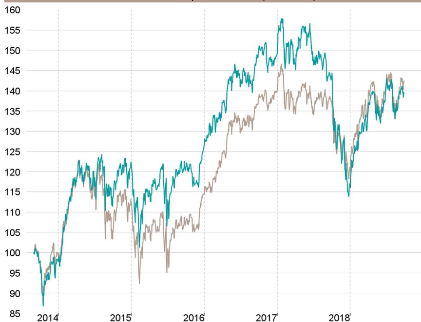
Evolution depuis création (base 100)

— Talence Euromidcap — Indice de référence