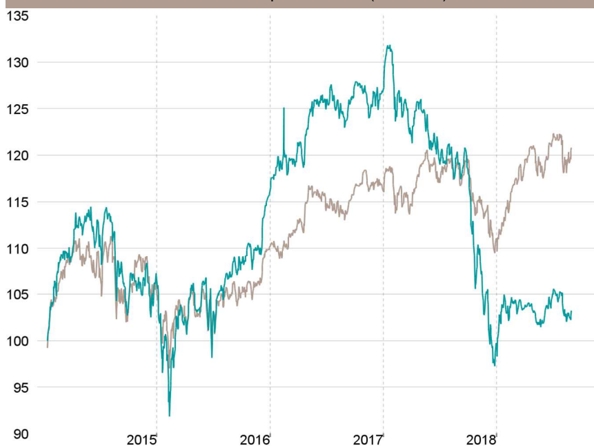
Evolution depuis création (base 100)