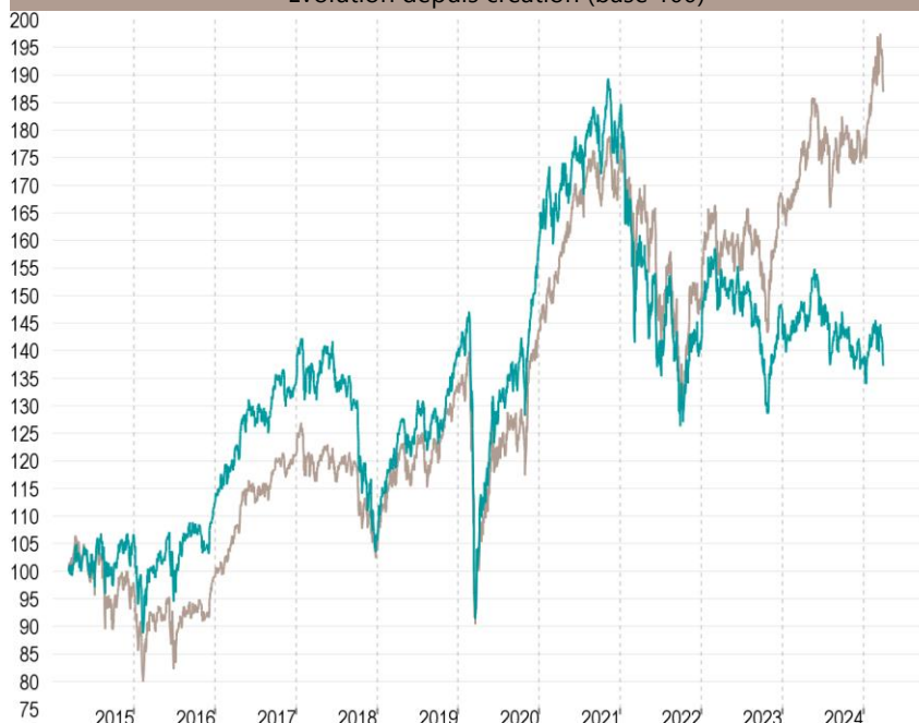
— Talence Euromidcap — Indice de référence

Les performances passées ne préjugent pas des performances futures et ne sont pas constantes dans le temps.