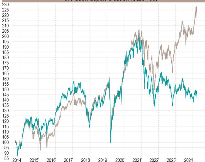
— Talence Euromidcap — Indice de référence

Les performances passées ne préjugent pas des performances futures et ne sont pas constantes dans le temps.